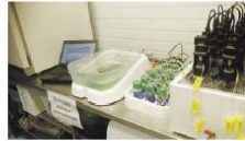
Utprovning för att mäta metanproduktion vid Växthuset i Umeå.

Den som följt med debatten känner till att tillgången på lättillgängliga näringsämnen minskar. Det är främst fosforgruvorna som man oroad sig för. Utvecklingen som jordbruket har upplevt sedan andra världskriget har till stor del berott på lättillgängligt och bra mineralgödsel. Samtidigt finns det krav på jordbruket att bekämpa övergödningen av Östersjön genom begränsningar på gödning. Hur kan jordbruket möta de här båda problemen, och finns det möjligheter till nya inkomstkällor? Botnia-Atlantica-projektet NP-balans och TransAlgae strävar till att hitta sådana lösningar.