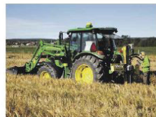
Provering av jord i Växthuset i Umeå.